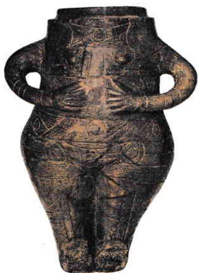
Zeița de la Vidra, Cultura Gumelnița cca 4200-3900 î.e.n.