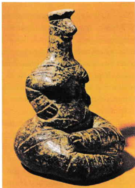
Zeița-Șarpe, perioada minoică, cca 2000 î.e.n.